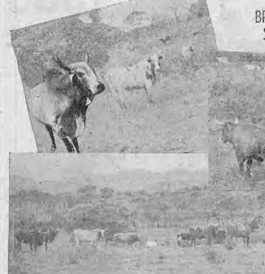
BRAVISIMO EL GANADO QUE SE LIDIARA EN LAS FIESTAS

Intercambio de... (VIENE de la pág. UNO) A cambio de la rebaja de los aranceles en Guatemala para la introducción de nuestros licores, Costa Rica podría conceder algunas ventajas a productos guatemaltecos, para que puedan ser introducidos en nuestro país; entre los productos que pueden traerse de Guatemala está la resina, de la cual se obtiene carbón de muy buena calidad.